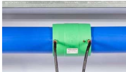
Figure 13 - Programmer le diamètre correct au transformateur. Lancer le processus.

L'assemblage ne peut être déplacé durant tout le processus de soudage ainsi que la période de refroidissement. Aucune tension ou force ne peut en outre y être exercée.