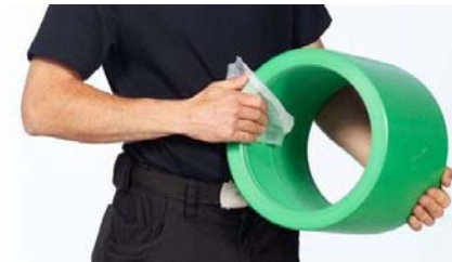
Figure 8 - Nettoyer l'intérieur du manchon électrique