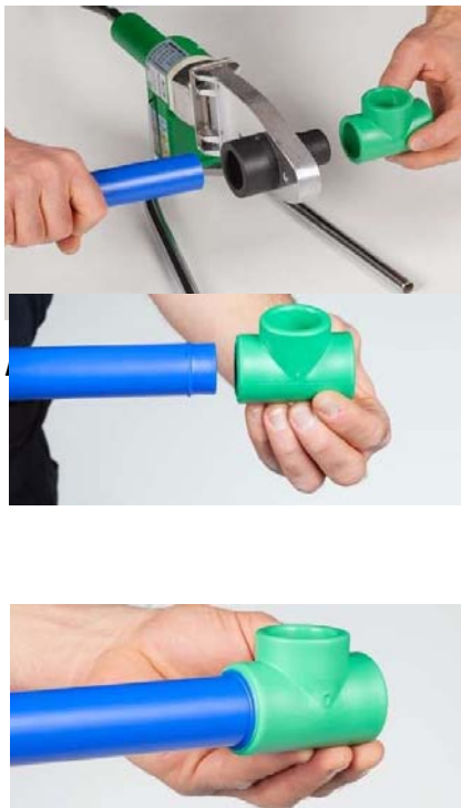
Figure 3 - Chauffage des éléments