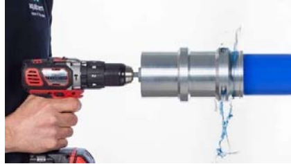
Figure 7 - Ebarber correctement les extrémités du tube et les nettoyer