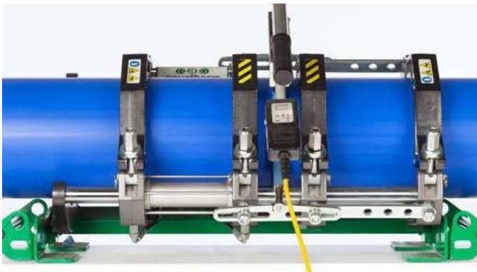
Figure 16 : Mise en place de l'élément de chauffe