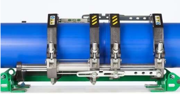
Figure 18 : Assembler les tubes et laisser refroidir