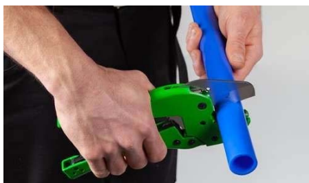
Figure 1 - Couper le tube