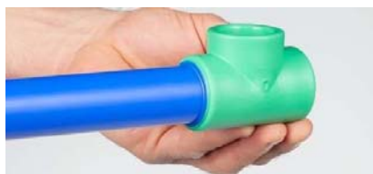
Tableau 3 – Temps de refroidissement après soudure par polyfusion