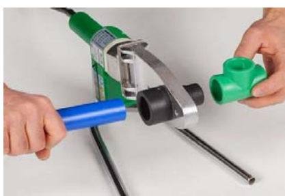
Figure 3 - Chauffage des éléments