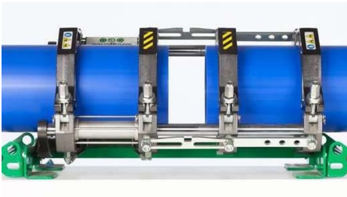
Figures 14 et 15 : Guider et fixer les éléments à assembler