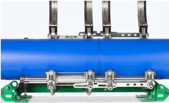
Figure 19 : Relâcher la pression et poursuivre le travail