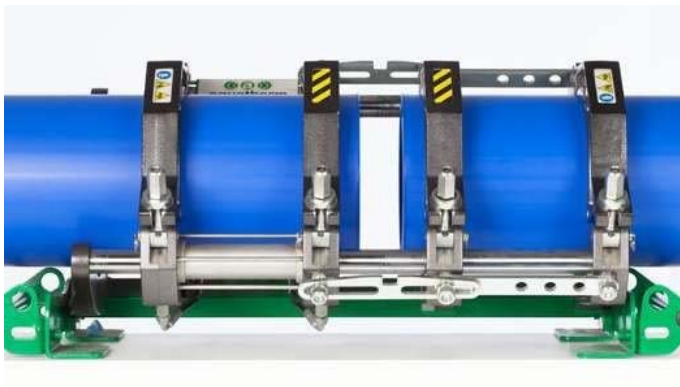
Figure 17 : Séparer les éléments et retirer le fer chauffant